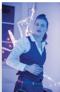
„ROOM SERVICE“ 2013