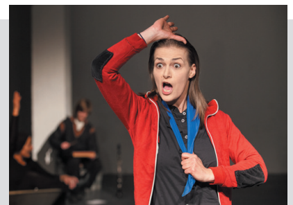
„MACHEN WIR DEM SPIEßER EIN FREUDE,“ 2013