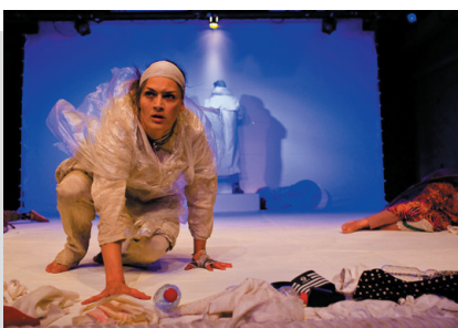
„SCHUTZFLEHENDE“ - 2014

Wohnort: Köln Wohnmögl.: Leipzig, Berlin, München, Stuttgart, Wien, Darmstadt, Oldenburg, Venlo, Hamburg Sprachen: Deutsch (Muttersprache), Niederländisch (fließend), Englisch Größe: 1,70 Konfektion: 38 Schuhgröße: 39 Haar-/Augenfarbe: Braun Gesangslage: Alt Tanz: Butoh, Improvisation, Standard, Lateinamerikanisch Instrumente: Kazoo, Blockflöte, Gitarre + Klavier (Basis) Führerschein: PKW Sport: Volleyball, Schwimmen Sonstiges: Stelzenlauf, Bühnenkampf